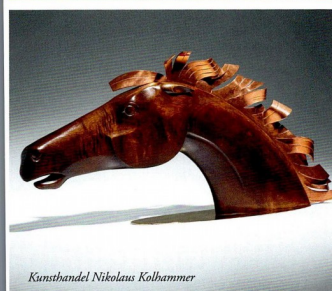
Kunsthandel Nikolaus Kolhammer