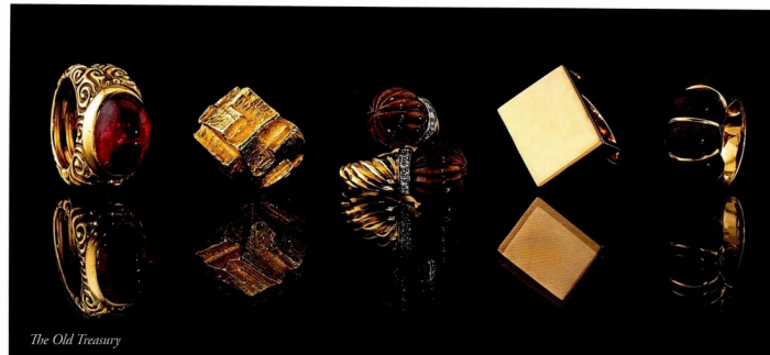
The Old Treasury