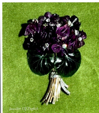
Inwelter Ulf English