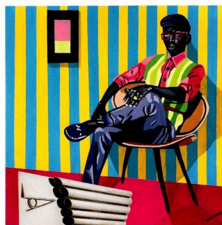
Schütz Art Society